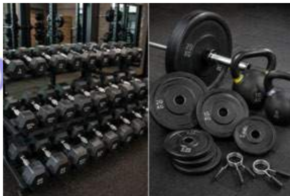
Слика 1. Опрема за тренинг со слободни тежини