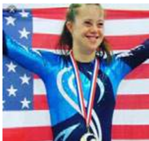
Слика 4. Американската гимнастичарка Челси Вернер – симбол на сила и посветеност во парагимнастиката

Особено значајна е примената на гимнастиката кај лица со аутистичен спектар на нарушувања. Истражувањата покажуваат дека гимнастиката има позитивно влијание кај лицата со аутистичен спектар. Bremer et al. (2016) наведуваат дека физичката активност: ја подобрува социјалната интеракција, ја подобрува моториката, го подобрува вниманието и ја намалува анксиозноста. Овие примери покажуваат дека гимнастиката може успешно да се приспособи без губење на нејзината суштина.