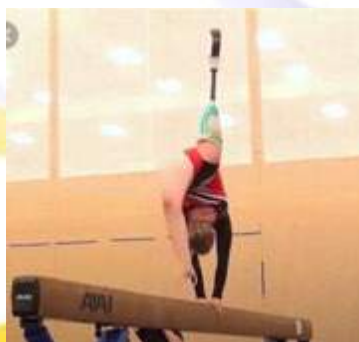
Слика 3. Не е потребна „совршена симетрија“ за квалитетна изведба на комплексни гимнастички елементи