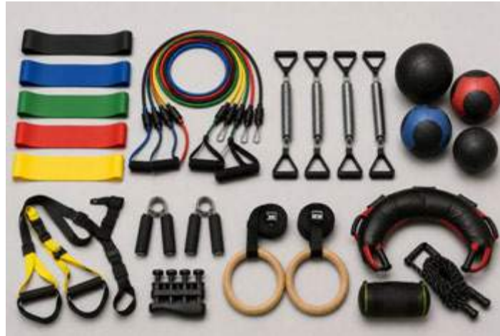
Слика 5. Едноставни и преносливи уреди за тренинг со отпор

контрола, како и за примена во рехабилитациски програми каде што е потребен висок степен на адаптација и контрола на движењето.