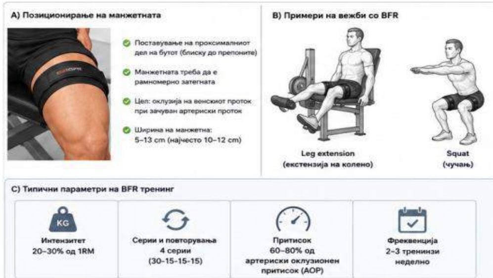
Слика 2. Правилна примена на манжетна (cuff) и позиционирање

Забелешка: Параметрите треба да се индивидуализираат според пациентот и протоколот. Адаптирано според Patterson et al. (2019); Centner et al. (2019).