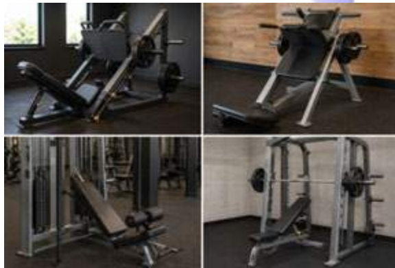
Слика 2. Примери на машини зависни од гравитацијата

Кај овие машини големината на надворешниот отпор зависи од механичката конструкција на уредот, аголот на движење и положбата на телесните сегменти. На овој начин се овозможува поголема изолација на таргетираните мускулни групи, но истовремено се намалува потребата за координација и функционална стабилизација. Најзастапени се лег-прес машините, хак-машините за чучнување, смит-машините и машините за потисок со дискови.