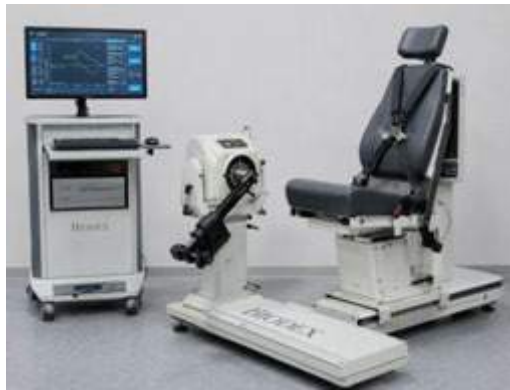
Слика 3. Изокинетички динамометар – уред за тестирање и рехабилитација на мускулната функција