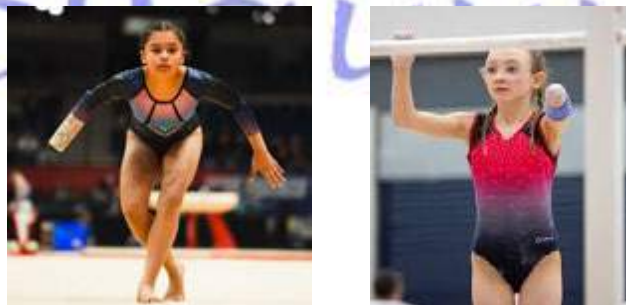
Слика 1. Гимнастичарка со ампутација на рака

Современите трендови во гимнастиката прикажани преку практични примери на социјалните мрежи како Фејсбук и Инстаграм покажуваат дека гимнастичките активности може успешно да се адаптираат за различни возрасни групи и способности. Сведоци сме на видеа каде што се прикажани лица со ампутации кои изведуваат елементи на партер, греда, разбој, модифицирани скокови и прескоци, користење помагала и адаптирана опрема за деца со аутизам.