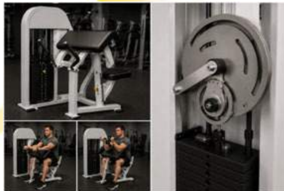
Слика 4. Уред со варијабилен отпор базиран на „кам“ механизам

Машините со варијабилен отпор (слика 4) се дизајнирани така што отпорот се менува во текот на движењето, со цел да се усогласи со биомеханичките карактеристики на мускулот. Ова може да се постигне преку кам-механизми кои се обидуваат да ги следат релациите сила – должина и сила – брзина на мускулот, со што отпорот се зголемува или намалува во зависност од промените во механичката предност во аголот на зглобот. Ова резултира со порамномерна мускулна активација и подобра искористеност на силивиот потенцијал во различни фази од движењето (Folland & Morris, 2008).